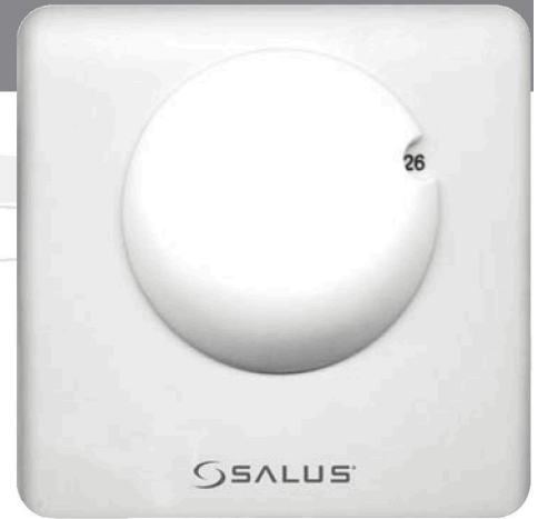
Model RT 100